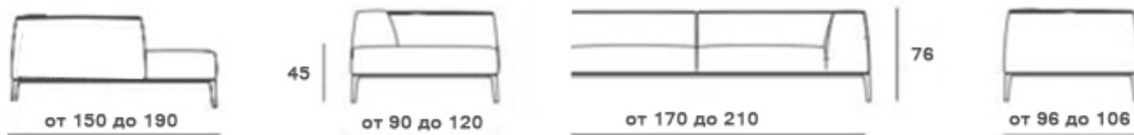
угловой диван без разделения сидения на 2-е части